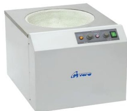
ESB 308, ESB 309